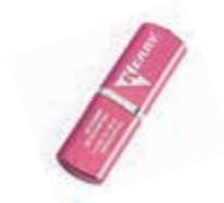
KR-R-400 USB flash накопитель KERRY