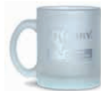
KR-R-311 Кружка стеклянная матовая KERRY