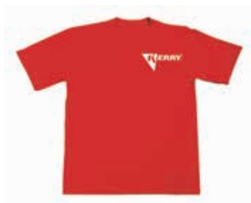
KR-R-211 Футболка KERRY (M) KR-R-212 Футболка KERRY (L) KR-R-213 Футболка KERRY (XL) KR-R-214 Футболка KERRY (XXL) KR-R-219 Футболка KERRY (XXXL)