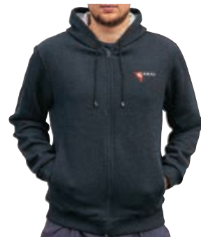
KR-R-231 Толстовка KERRY (M) KR-R-232 Толстовка KERRY (L) KR-R-233 Толстовка KERRY (XL) KR-R-234 Толстовка KERRY (XXL)