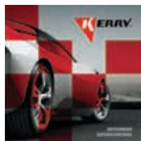
KR-R-011 Каталог KERRY