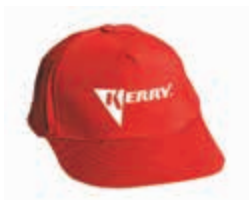
KR-R-290 Бейсболка KERRY