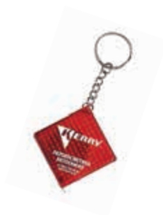
KR-R-379 Брелок-рулетка свето-отражающий KERRY