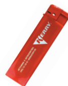
KR-R-380 Зажигалка пьезо KERRY