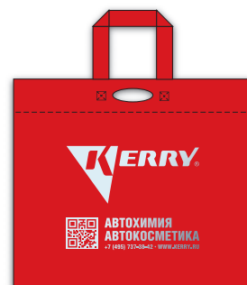
KR-R-365 Сумка KERRY, 338×445 мм