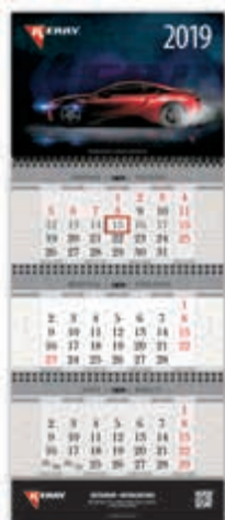
KR-R-006 Календарь кварталный KERRY