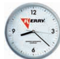
KR-R-340 Часы настенные KERRY