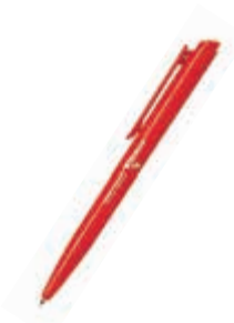
KR-R-320 Ручка шариковая пластмассовая KERRY