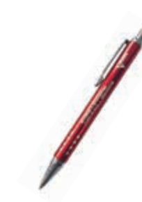
KR-R-321 Ручка шариковая металлическая KERRY