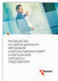
KR-R-022 Руководство по мерчандайзингу KERRY