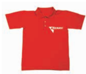
KR-R-221 Рубашка-поло KERRY (M) KR-R-222 Рубашка-поло KERRY (L) KR-R-223 Рубашка-поло KERRY (XL) KR-R-224 Рубашка-поло KERRY (XXL)