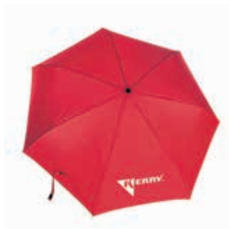
KR-R-371 Зонт красный KERRY