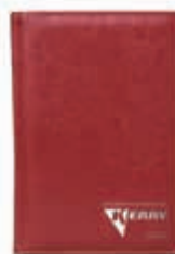
KR-R-090 Ежедневник KERRY