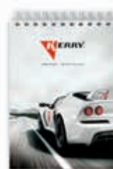
KR-R-091 Блокнот KERRY