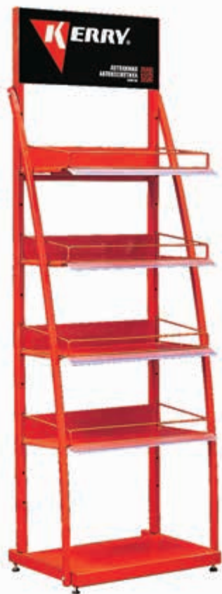
KR-R-002 Стойка рекламная металлическая KERRY