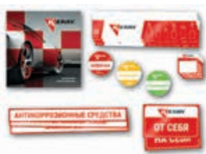
KR-R-031 Набор POS-материалов KERRY